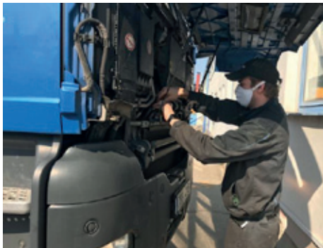
Opravárenské práce pokračovaly

Koronavirová krize se nevyhnula ani našemu servisnímu středisku v Břeclavi. Bylo potřeba upravit systém fungování a pohybu v rámci ser-