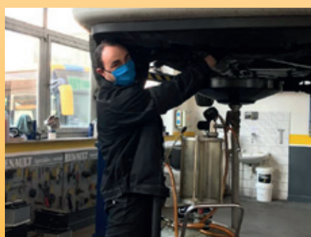
Opravárenské práce pokračovaly

Renault – kvůli nařízení vlády ČR bylo nutné zcela uzavřít prodejnu nových vozů, a tím pádem se prodej zcela zastavil. Na servisu došlo ke značnému poklesu zakázek a díky uzavření hranic nebylo možné přijímat ani zákazníky z Rakouska a Slovenska.