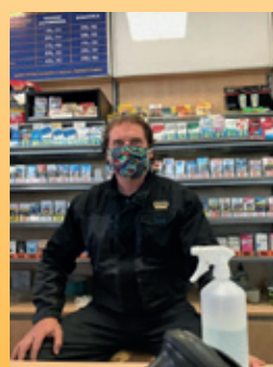
Čerpací stanice měla otevřeno

Čerpací stanice – na čerpací stanici bylo nutné omezit některé služby jako ruční mytí a čištění vozidel. S tím jsme upravili i provozní dobu a umožnili zákazníkům využívat „bezkontaktní“ tankautomaty.