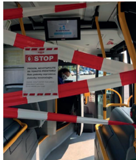
Omezení v autobusech

riziko nižších tržeb na straně objednavatele, a tak se v našich výsledcích projevil spíše úbytek výnosů díky prázdninovému režimu, který činí cca 10 %. Na druhou stranu pozitivním dopadem byla úspora ve spotřebě PHM (málo