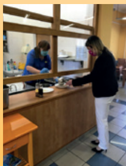
Zvláštní režim jsme měli i v jídelně, kde jsme museli sedět odděleně